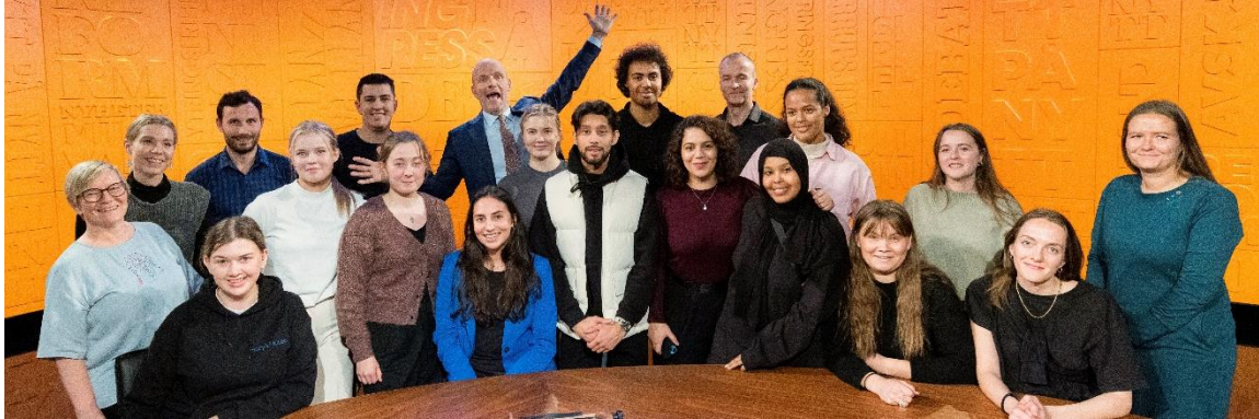
NYTT PÅ NYTT: Dei tre rekrutteringstiltaka samla i studio etter innspeling av Nytt på nytt.

Møte med kringkastingsjefen, Nytt på Nytt og andre NRK-stjerner var berre nokre av høgdepunkta då NRK for første gong samla alle praktikantane frå NRKs tre talentprogram til ei felles fagleg samling på Marienlyst i Oslo.